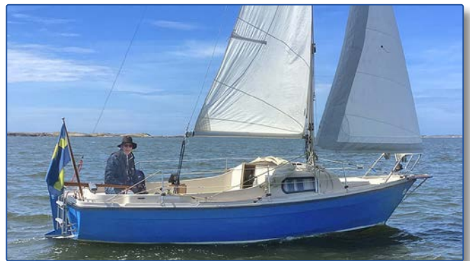
Smakprov från eskaderseglingen i juni.