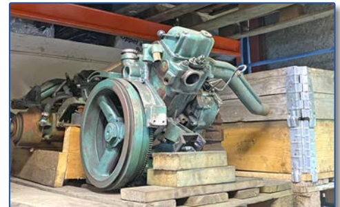
MD6A-B, MD7A-B, 2001, 2002, 2003 MD5, i massor!