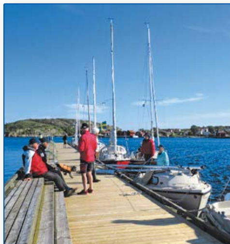
Gallmåven var mastlös några minuter