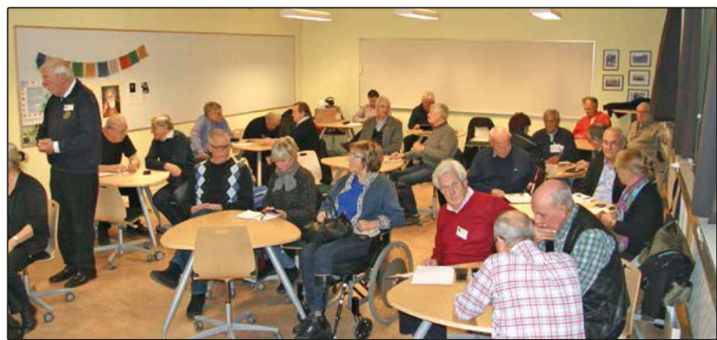
Vänster: Ett välbesökt möte.