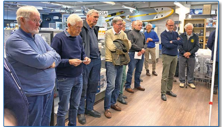
Varför kom inte damerna med på bild..?