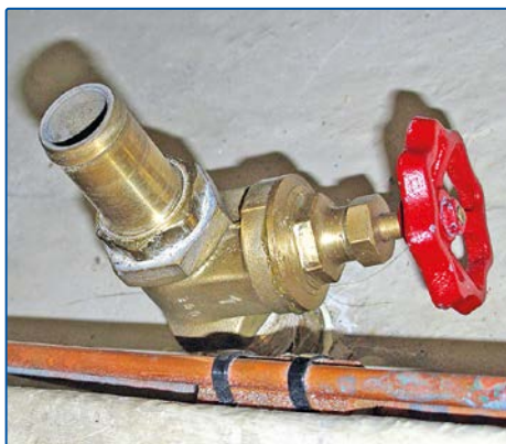
Självlänsens skjutventil renoverad och monterad med tätningsmedel. Kopparrören i bildens nedre del är för matning och retur av bränsle.