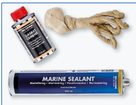
Packningscement, lin samt polyuretanbaserad tätmassa, allt från Biltema men du väljer själv leverantör.