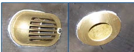
Nya genomföringar, till vänster kylvattenintag och till höger självläns.

Sedan är det dags att gänga på det som nu ska gängas på. Du har tidigare kollat i vilket läge gångorna börjar "ta" och räknat hur många varv du kan dra för att komma i rätt läge.