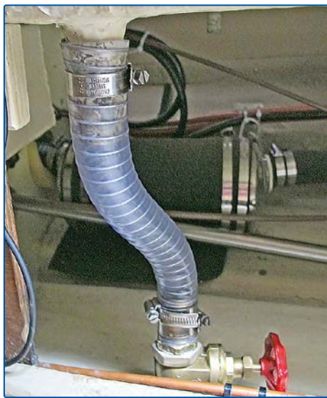
Självlänsen med ny slang och rostfria slangklämmor. Det ska vara dubbla motstående slangklämmor för att godkännas vid en ev. besikning. Som synes är det dubbla nedtill men enkel upptill.