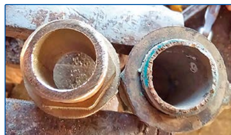
Medlem #120 Kaj J. fick för sig att byta genomföringar till självlänsen. Originalen th. brast vid försök till demontering. Lägg märke till skillnaden i godstjocklek jämfört med den nya tv.