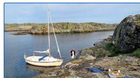
6367363, 1266896 Onsala: Mellan Hamnholmen och Öckerö Kalv.