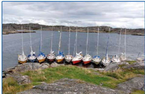
Utkåften A 6423087, 1249584