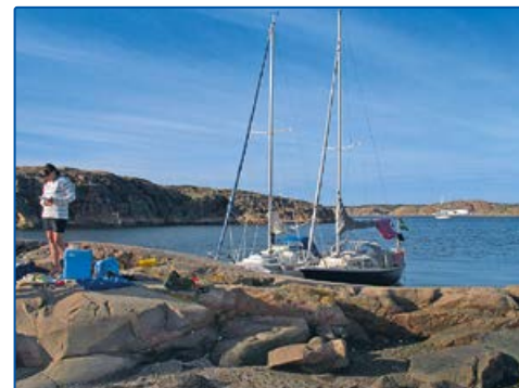
6473938, 1240907 Bläckhall