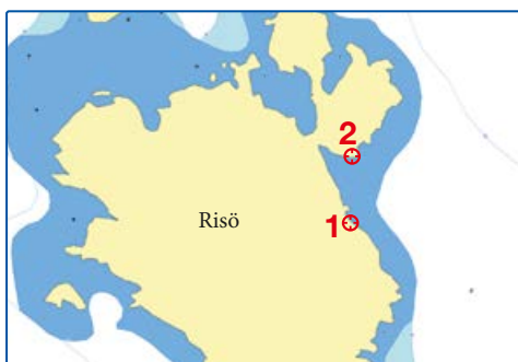
Risö, norr om Bohus Björkö 6412568, 1254622