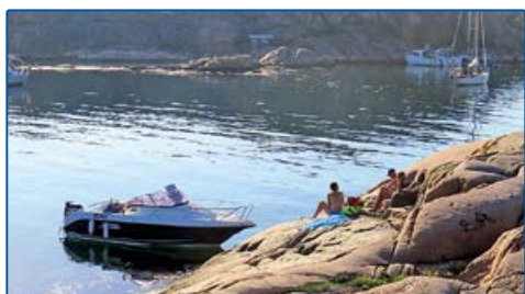
6472519, 1238190 Brandskärs hamn