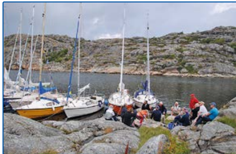
Utkåften B 6423248, 1249972