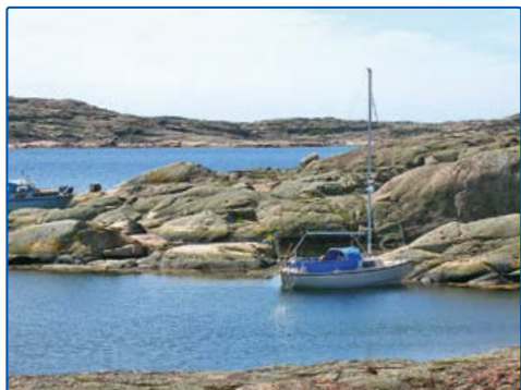
6474956, 1240886 Lindholmen