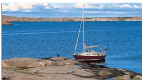
6471805, 1237628 Västingskär