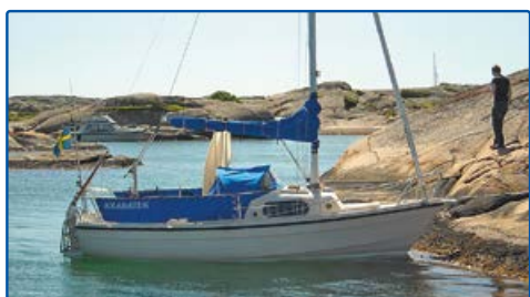
6466708, 1240742 Tjällsö holme