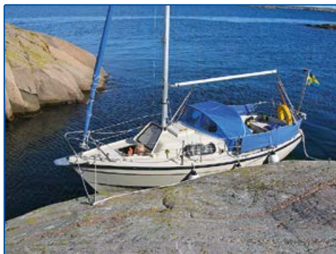
6471667, 1237728 Västingskär