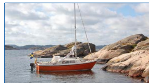
6447955, 1253062 Hälsön, Stigfjorden