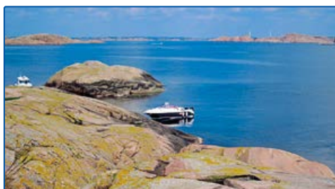
6471306, 1237914 Gråurn