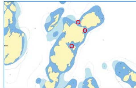
6471302, 1238365 Borgmästaren