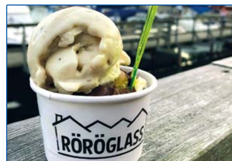
Rörö glasscafé 6413111, 1250819