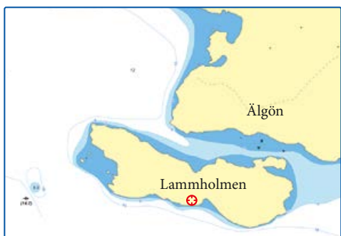
6428905, 1255729 Lammholmen