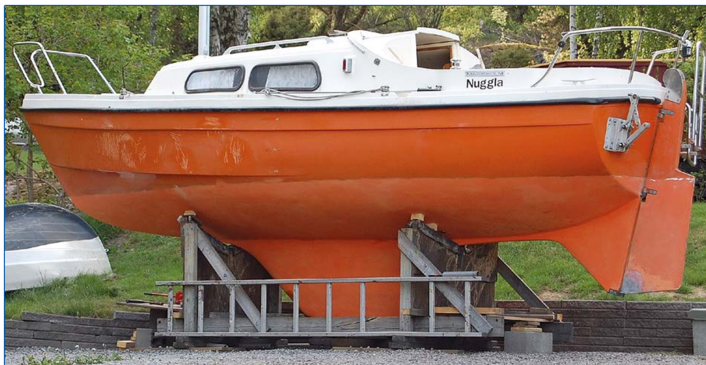
Båten med renslipad botten.