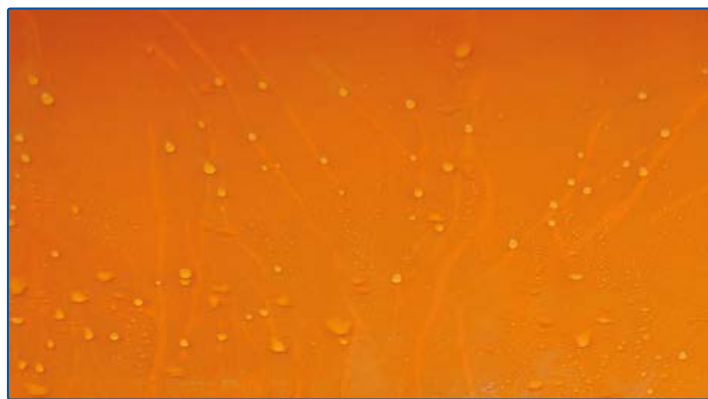
Fribord Hösten 2015 (med vattendroppar)