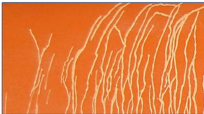
Uppslipad fribord 2008