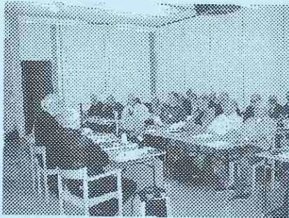
Årsmötet har börjat